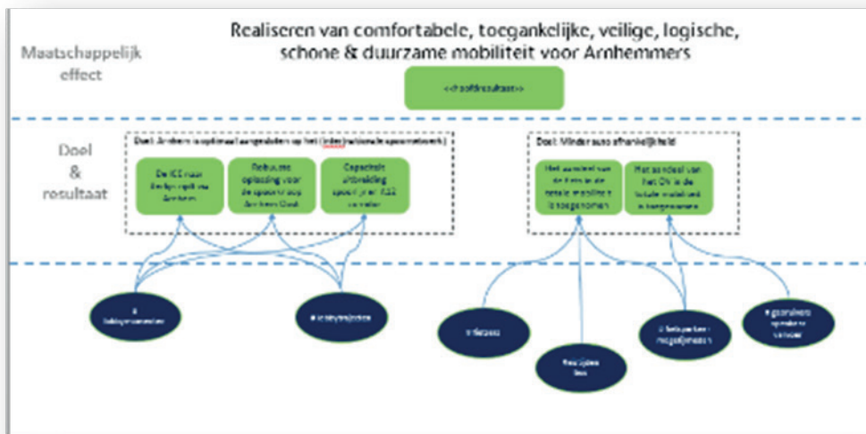
Figuur 2: Een voorbeeld van een model om vanuit effecten en doelen uit het programma de concrete resultaten met daarbij de relevante en beschikbare indicatoren te formuleren.